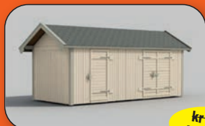
Redskapsbod Peter 15-1 Supertilbud!

Kampanjepris gjelder så langt lagert rekker