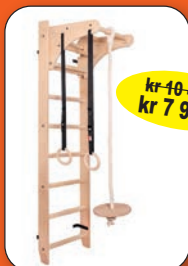
BenchK ribbevegg 111+A204 - serie 1