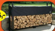
Kraftig Vedstativ 240cm Ultra Duty

Kampanjepris gjelder så langt lagert rekker