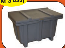
Strøsandkasse/ Strøkasse 200 Liter